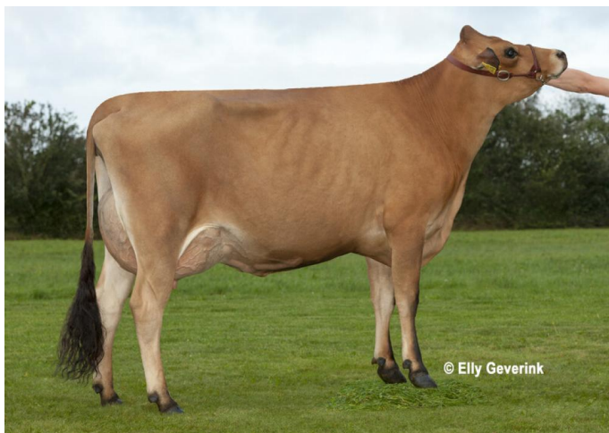
Mutter von Value-PP