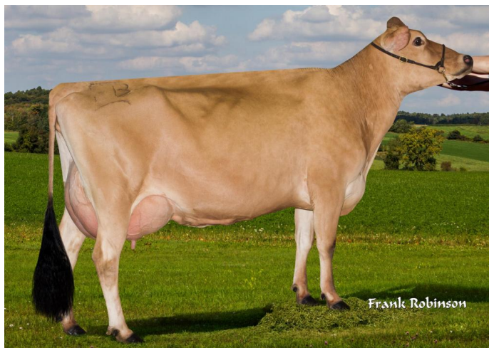
Faria Brothers Harris Wallace VG-85 (Mutter)