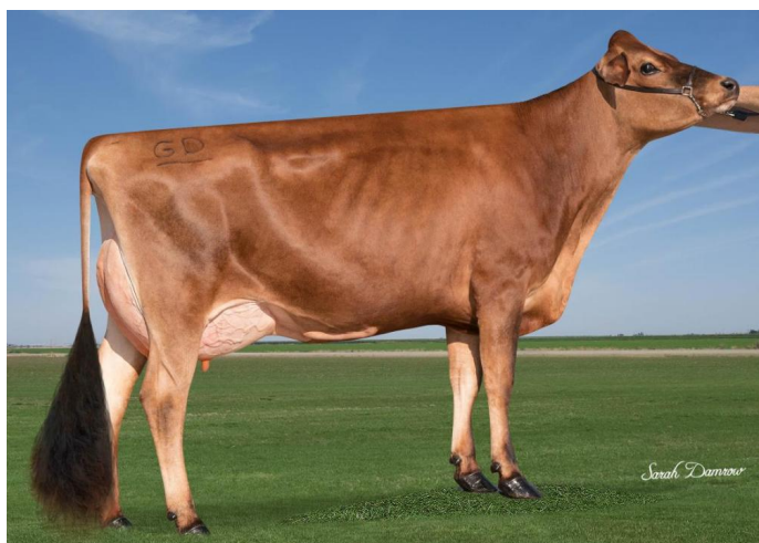
Jx Jer-Z-Boyz Patron 61600 (Tochter)