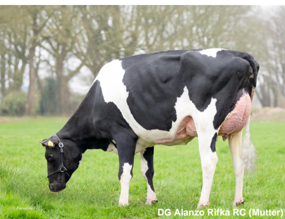
DG Alanzo Rifka RC (Mutter)