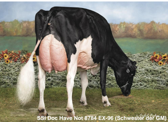
SSI Doc Have Not 8784 EX-96 (Schwester der GM)