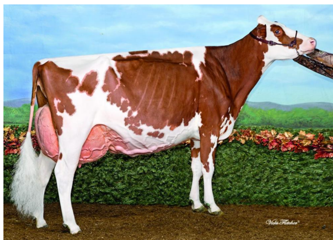
Miss Apple Snapple-Red EX-96 (Großmutter)