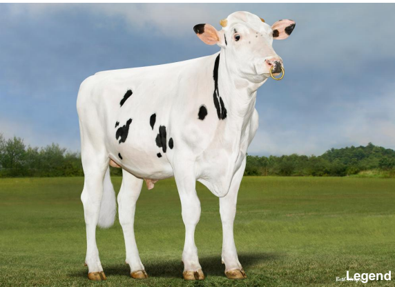
Aurora Perfect 23719 VG-88 (Großmutter)