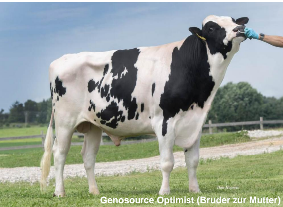
Genosource Optimist (Bruder zur Mutter)