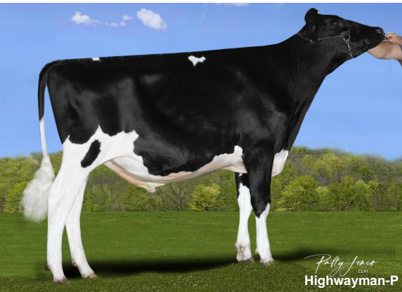
Polly Jones Highwayman-P