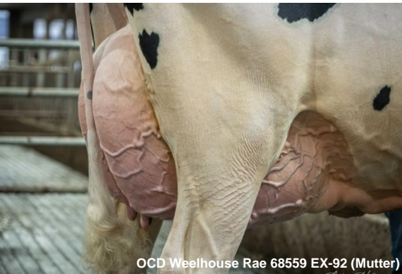
OCD Weelhouse Rae 68559 EX-92 (Mutter)