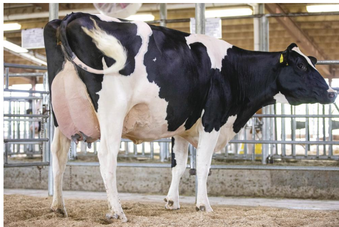
Siemers Denver Paris EX-91 (Vollschw. der GM)