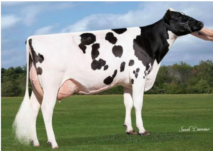
WET Hotshot Maud-ET VG-85 (3. Mutter)