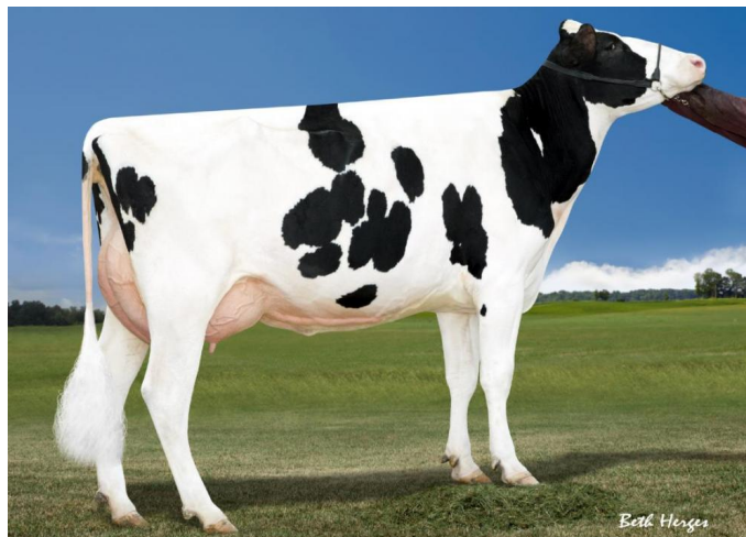
Robust Delicious VG-87 (Stammkuh)