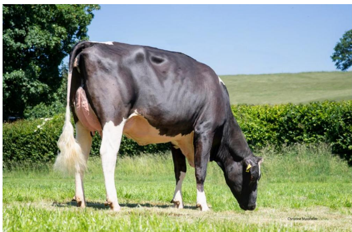
OCD London VG-86 (Mutter)