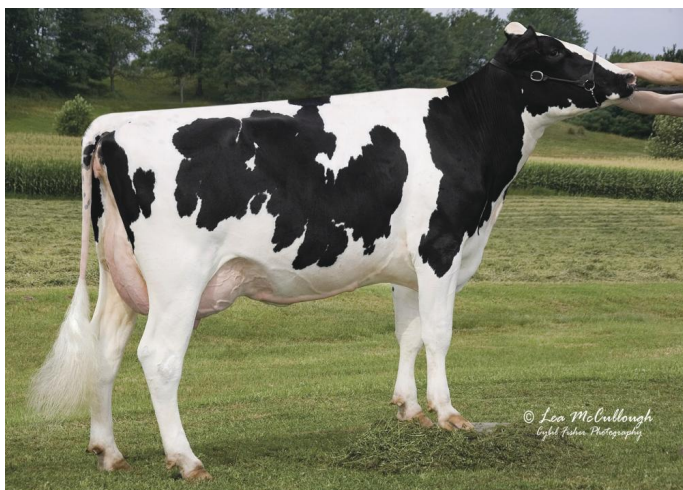
Sully Shottle Otomique-ET EX-90 (Stammkuh)