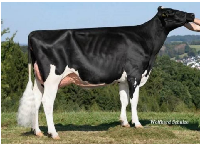
Col DG Brylin VG-86 (Großmutter)